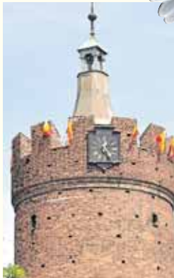
Wer an der Hauptkirche kein Glück hat - auch vom Werder-Turm hat man einen herrlichen Ausblick

ER ist aus keiner Schlagerparty wegzudenken – Andy Borg begeistert nicht nur seine Anhänger mit seinen eingängigen Songs und seiner ehrlichen Art. Der gebürtige Wiener ist trotz seines Erfolges auf dem „Teppich“ geblieben. Zu erleben am Sonntag, 18 Uhr