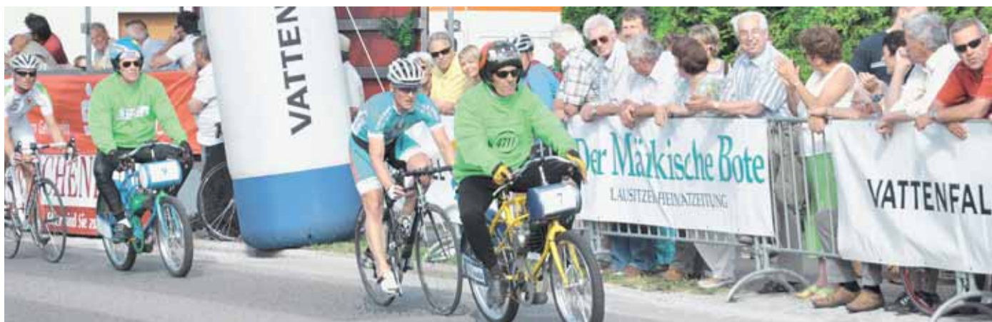
Mit bis zu 70 km/h rasen die Teams vor begeistertem Publikum um die Griefener Wehrkirche