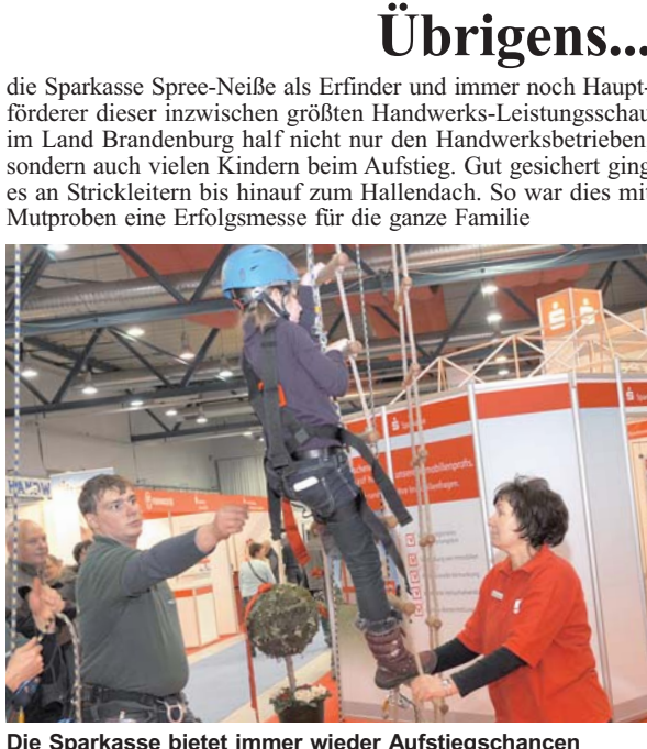
Die Sparkasse bietet immer wieder Aufstiegschancen