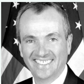
Philip D. Murphy

Der FC Energie begrüßte am Dienstagnachmittag den Botschafter der Vereinigten Staaten von Amerika, Philip D. Murphy . Der Diplomat outete sich als großer Fußball-Fan, der beim Heimspiel gegen den