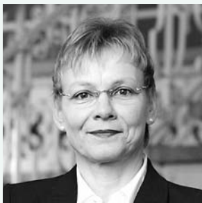
Prof. Dr. Sabine Kunst

Prof. Dr. Ing. Dr. phil. Sabine Kunst ist neue Ministerin für Wissenschaft, Forschung