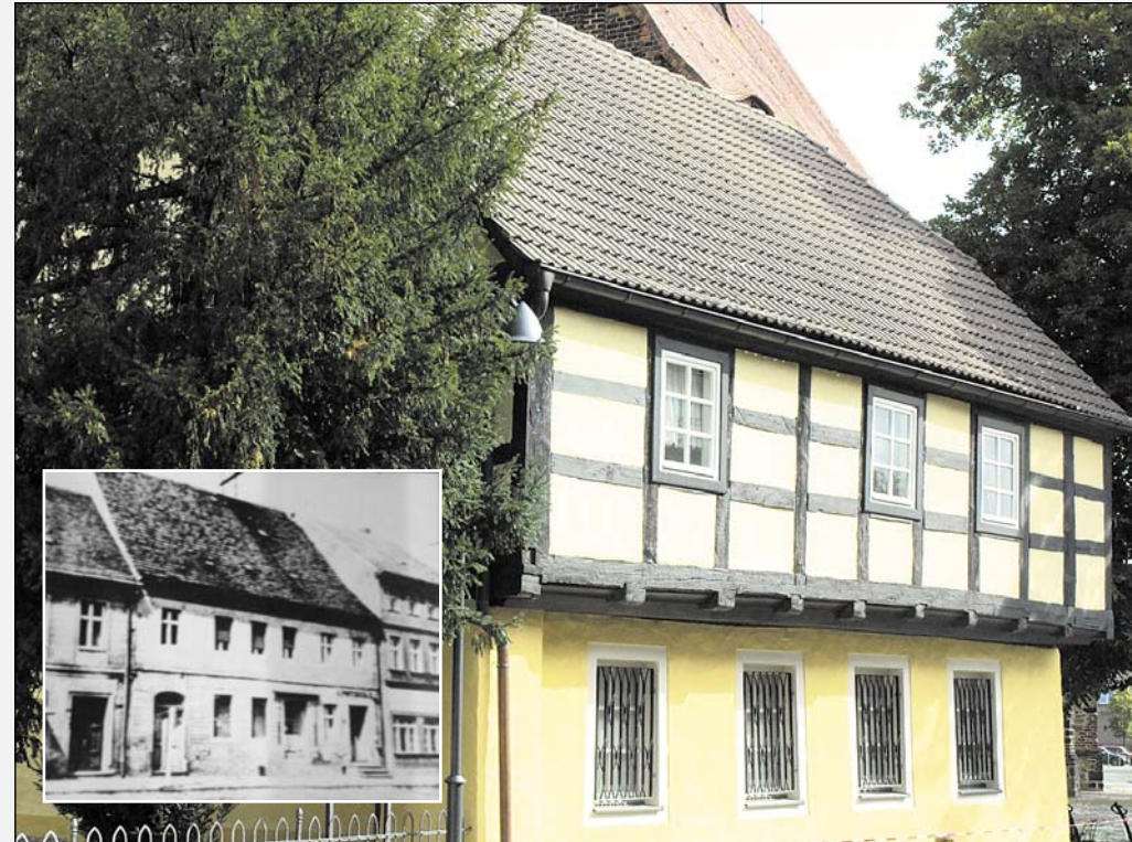
Im Calauer Heimatmuseum (großes Bild) befinden sich Dokumente über Carl Anwandter, der 1829 in der Stadt eine Apotheke eröffnete (kl. Bild), die es heute noch gibt